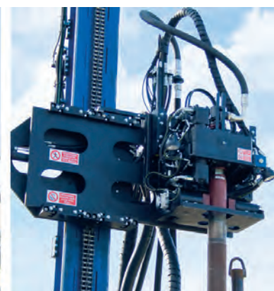
Groupe spécial tête modèle JOY 2 / Teilansicht Kopfgruppe Modell JOY 2

Les données et les images figurant dans le présent catalogue sont purement indicatives, Hydra se réserve le droit de les modifier sans préavis.