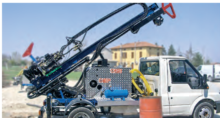
JOY 2 monté sur camion / JOY 2 auf Lastwagen montiert