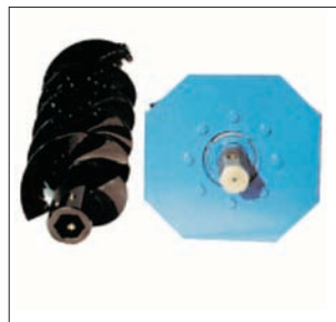
Vue prise hexagonale Ch 50 Ansicht Sechskantanschluss Ch 50