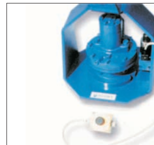
Tête avec commande d'inversion de rotation Bohrkopf mit Drehumkehrsteuerung