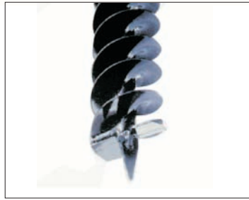
Couteaux à terre Bodenmesser