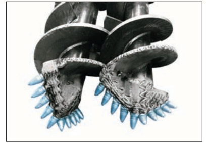
Pointes pour sols pierreux, rocheux pour série "Mini" Bohrspitzen für steinige und felsige Böden der Serie "Mini".